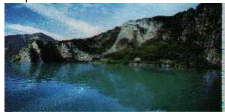
Orrido - Bogn di Castro

Altro paese turistico è CASTRO , da ammirare il bel porticciolo costeggiato da antichi caseggiati. Da qui parte la vecchia strada a tratti suggestiva, o inquietante presso l'orrido del Bogn , scavata nella roccia e che percorre tutta la sponda occidentale del Sebino.