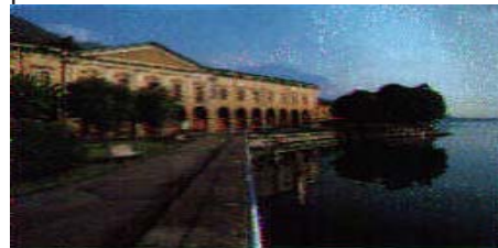
Lovere - Palazzo e Accademia Tadini

Il paese è oggi ricco di ristoranti, luoghi di ritrovo, club, di nautica, vela e wind-surf, dal suo porticciolo si può approfittare dei vaporetto per effettuare piacevoli traversate lacuali.